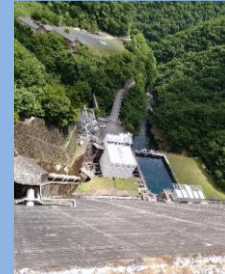
ダムから見た谷側